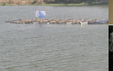
ગામ તળાવોમાં પિંજરા પધ્ધતિથી મત્સ્યપાલન