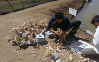
બગાસનો ઝીંગાપાલનમાં ઉપયોગ