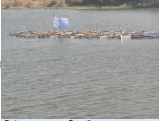
પિંજરા પધ્ધતિથી મત્સ્યપાલન