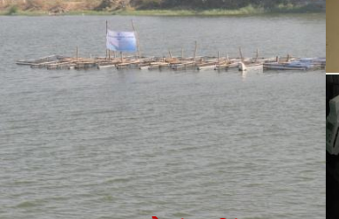
ગામ તળાવોમાં પિંજરા પધ્ધતિથી મત્સ્યપાલન