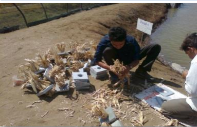
બગાસનો ઝીંગાપાલનમાં ઉપયોગ